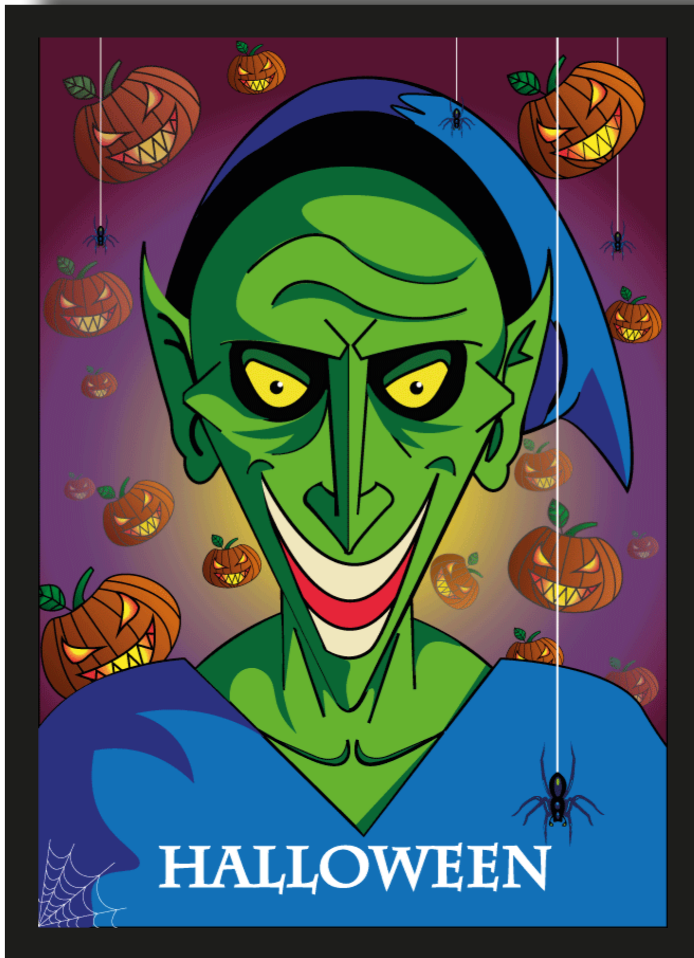
Illustration pour halloween